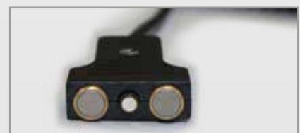
Para modelos portátiles y modelos de 2x